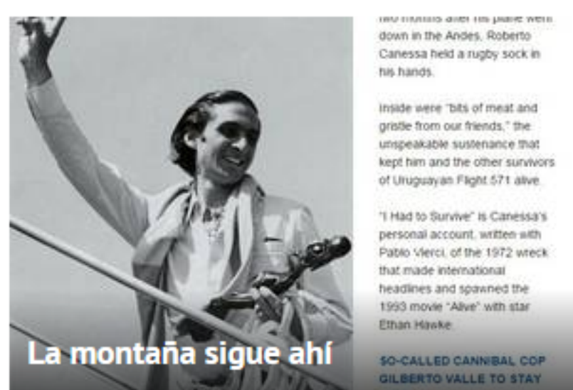
La montaña sigue ahí