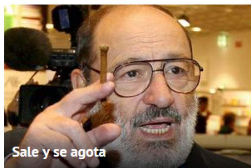
Sale y se agota