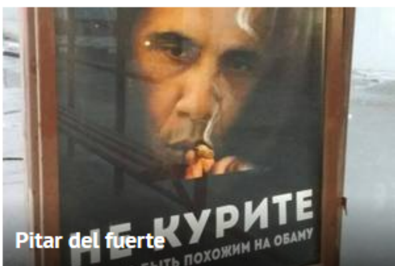
Pitar del fuerte