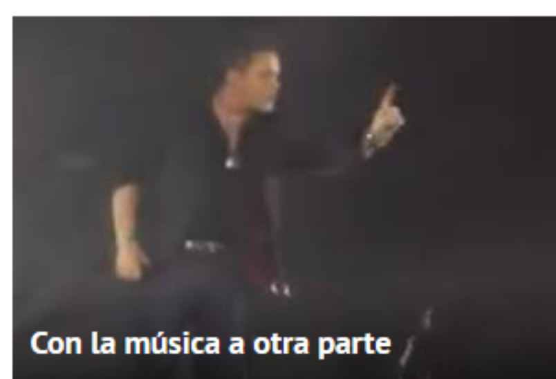
Con la música a otra parte