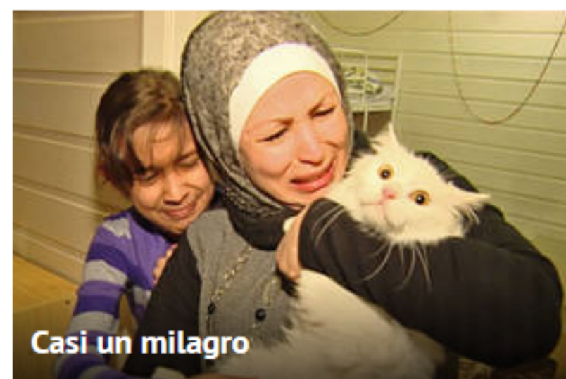
Casi un milagro

Montevideo Portal para móviles Disponible en iOS y Android