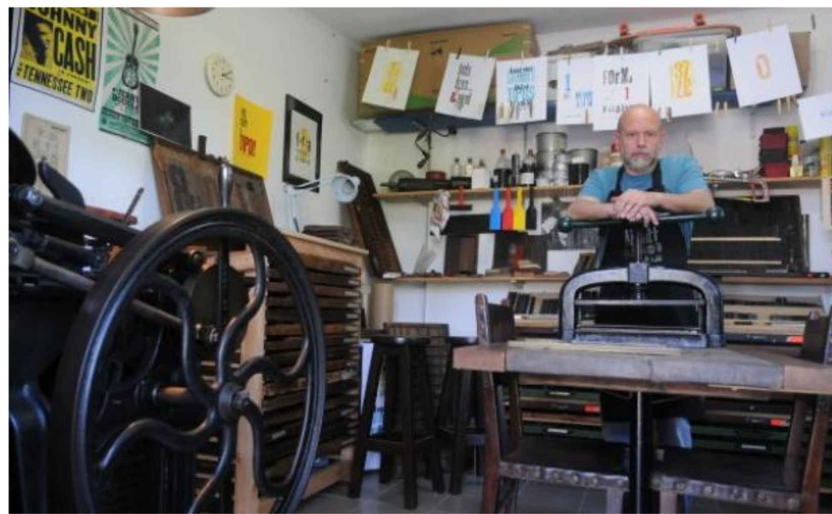
El imprentero en su taller.