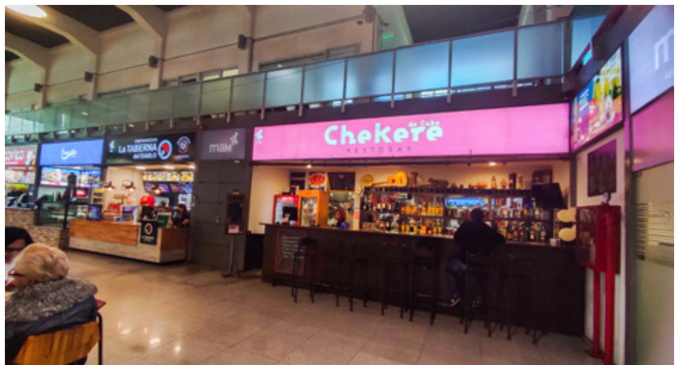
2022, fotografía, José L. Terra y Amézaga (Mercado Agrícola), Montevideo, Uruguay

Si observamos signos marcarios de comercios cubanos, venezolanos y uruguayos podemos reconocer valores visuales y lingüísticos como signos de migración y multiculturalismo.