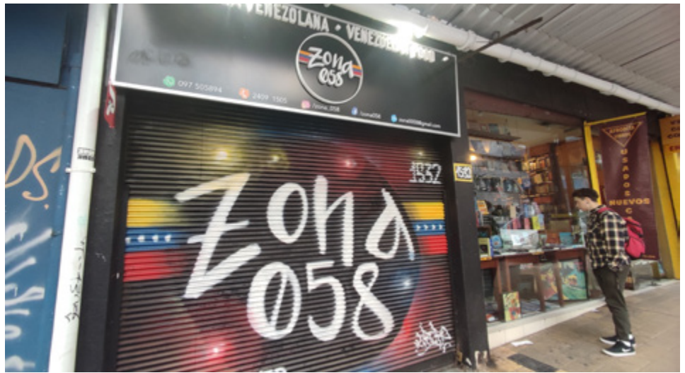
2022, fotografía, Dr. Tristán Narvaja 1532, Montevideo, Uruguay.

A nivel general, en Uruguay predominan las formas geométricas tradicionales, no tanto así en las artes visuales donde hay una variedad de figuras tanto orgánicas o accidentales, regulares e irregulares. En cuanto a los colores, en casi todas las expresiones, predominan los neutros, plenos, con combinaciones análogas.