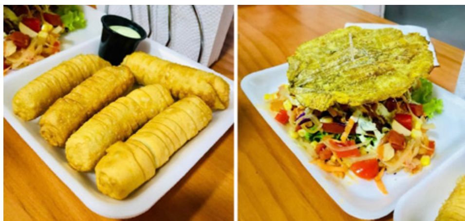
De izquierda a derecha: Tequeño y Petacón, Paladar Venezolano.

Ambos platos típicos venezolanos de Arepas y algo más (Uruguay).