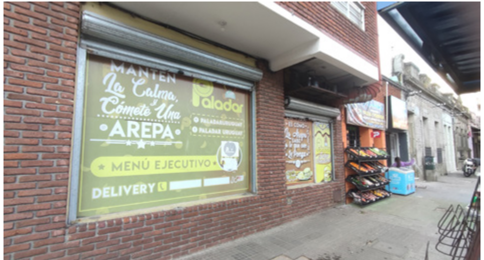
2022, fotografía, Gonzalo Ramírez 1415, Montevideo, Uruguay