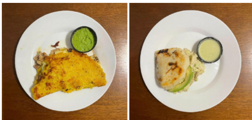
De izquierda a derecha: Cachapa de cerdo con salsa verde y Arepa reina pepiada con salsa de ajo.

Últimamente, en el mercado uruguayo se puede encontrar mayor cantidad de estos productos, así como gran cantidad de restaurantes que preparan los platillos típicos de cada uno de los lugares extranjeros mencionados. Este asunto tiene un lugar importante en la influencia cultural, ya que los alimentos y los distintos tipos de preparaciones son algo que tiene muy buena aceptación en la sociedad uruguaya.