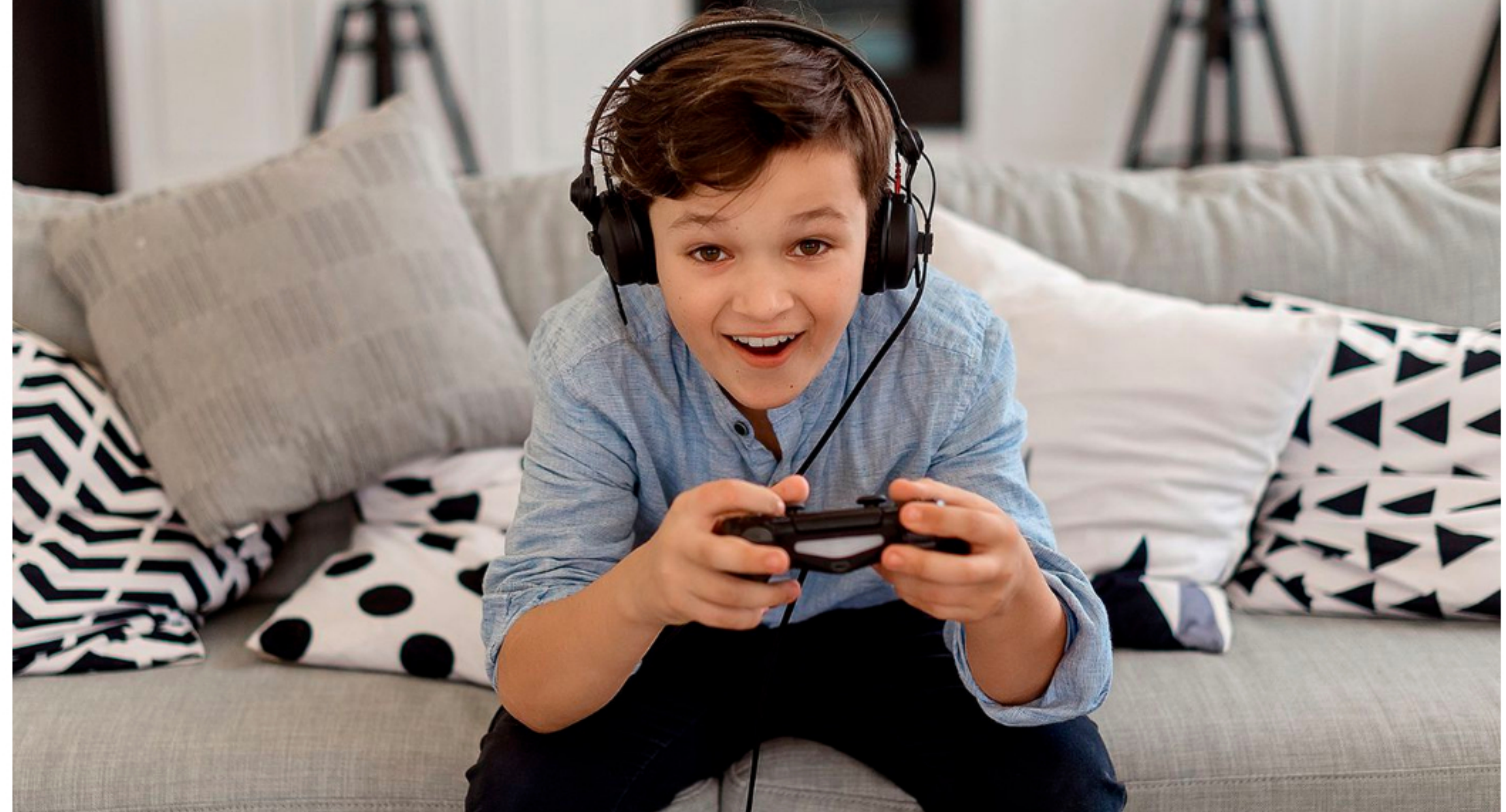
El uso de videojuegos creció exponencialmente durante la pandemia.

El viento de cola que empuja el barco gamert también sopla en nuestro país. De acuerdo a un informe de la plataforma Flow, el consumo de Internet para gaming creció más del 100% en la Argentina durante la primera semana de cuarentena y casi el 70% en todo el período de aislamiento . El relevamiento señaló, además, que hay un 20% más de jugadores y que más del 40% de los gamers profundizaron su hábito.