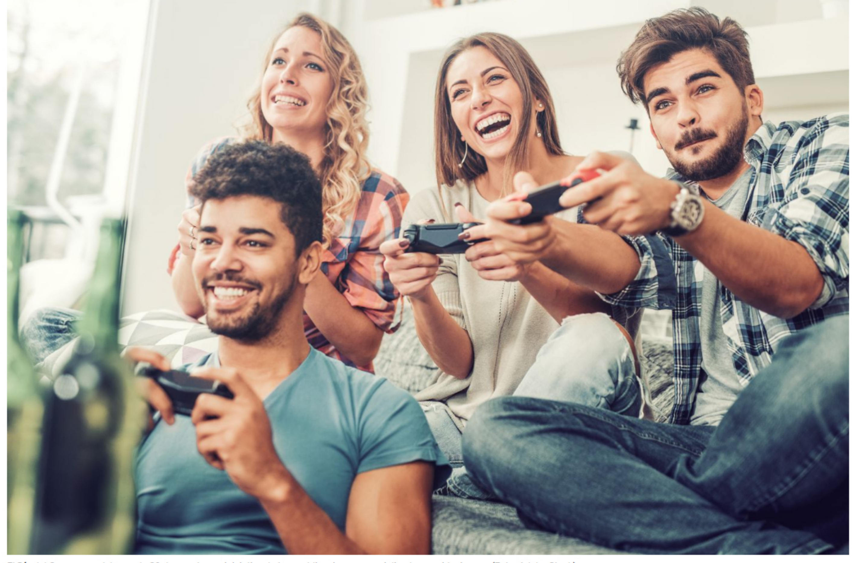
El Día del Gamer se celebra cada 29 de agosto por iniciativa de tres publicaciones especializadas en videojuegos.

La celebración surgió en el año 2008 gracias a una iniciativa de algunas de las más renombradas publicaciones especializadas en videogames . Las responsables de instaurar el Día del Videojuego fueron las revistas PlayMania , Hobby Consolas y PC Manía . Tal como señalamos, la elección de la coordenada temporal no responde a un acontecimiento específico.